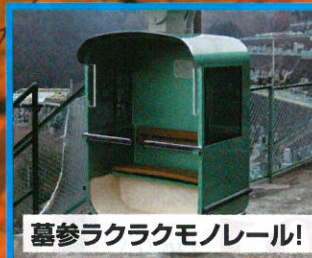
墓参ラクラクモノレール!