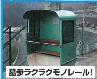
墓参ラクラクモノレール!