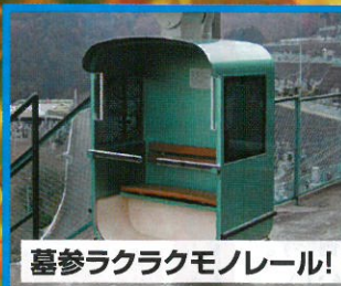
墓参ラクラクモノレール!