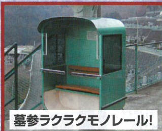
墓参ラクラクモノレール!