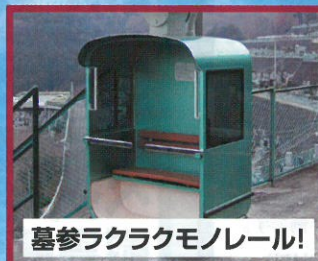
墓参ラクラクモノレール!