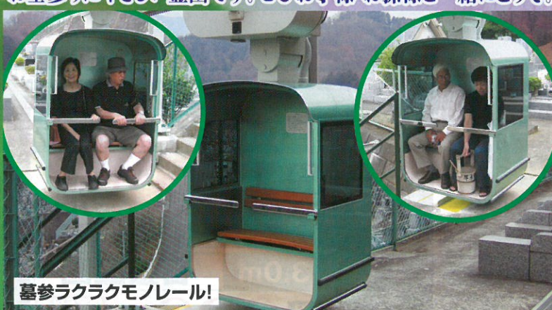
喜参ラクラクモノレール!