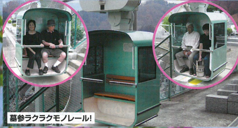
墓参ラクラクモノレール!