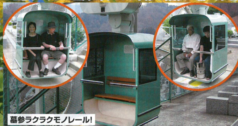
墓参ラクラクモノレール!