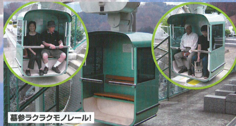
墓参ラクラクモノレール!