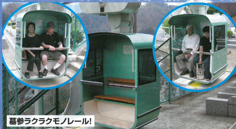
墓参ラクラクモノレール!